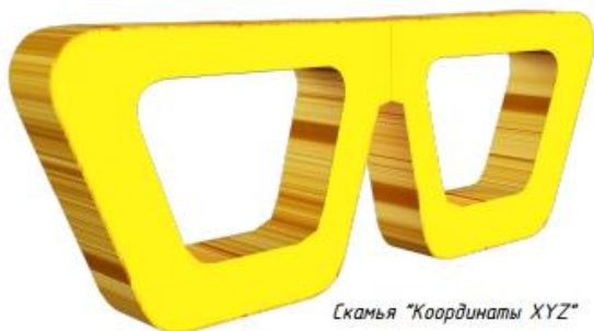
Скамья "Координаты XYZ"