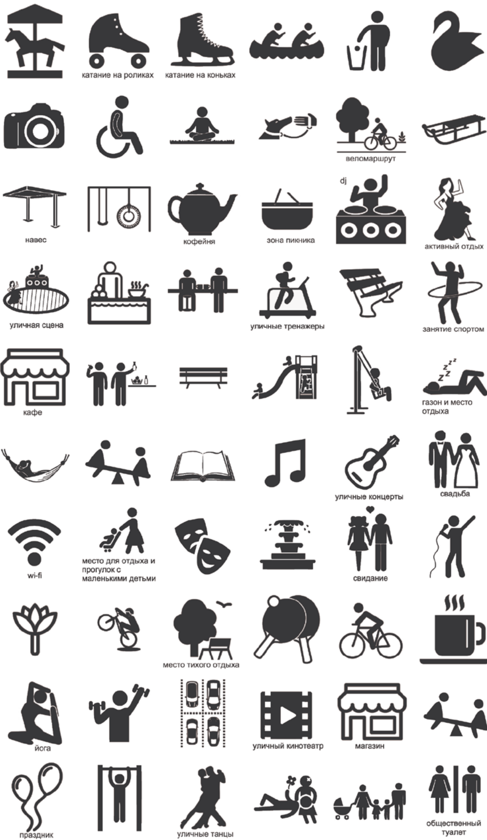
Пример набора значков для проведения дизайн-игры, используемых для работы с картой